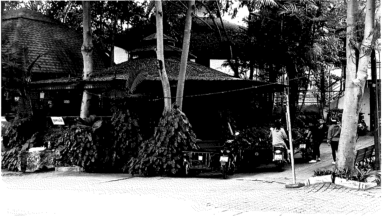
รายการที่ ๑ ร้านกาแฟสำเร็จรูป กว้าง ๗.๗๓ ม x ยาว ๗.๗๓ ม.