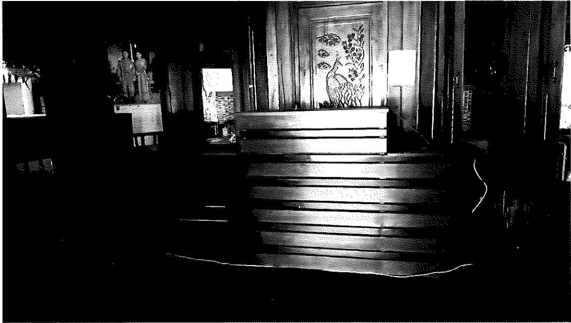
รายการที่ 2 โต๊ะทรงสูงเข้ามุมไม้สัก ขนาด กว้าง ๐.๔๐ x ยาว ๒.๕๓ x สูง ๑.๐๕ ม.