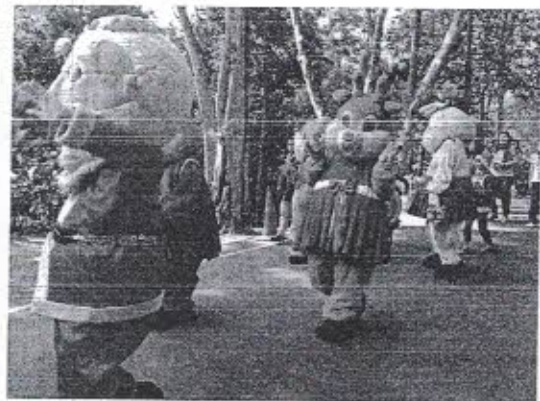
ภาพตัวอย่างการแสดงวันหยุดนักขัตฤกษ์