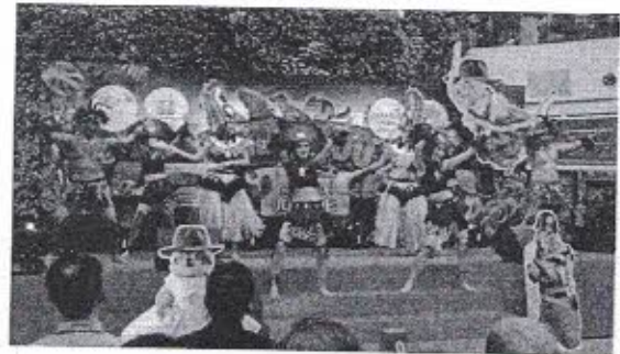
ภาพตัวอย่างการแสดง ซาฟารี และล้านนาซาฟารี